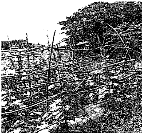
Figure 2 Soil grown Japanese cucumber